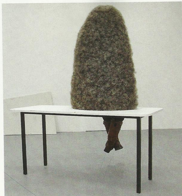
Nicolas Momein, Développé cardé , 2011, acier, crin, 104 x 62 x 37 cm (GALERIE WHITEPROJECT, PARIS).

« HEIMO ZOBERNIG », galerie Chantal Crousel, 10, rue Charlot, 75003 Paris 01 42 77 38 87 http://crousel.com et La Douane, 1, rue Léon-Jouhaux, 75010 Paris 01 42 01 64 97 du 21 janvier au 2 mars.